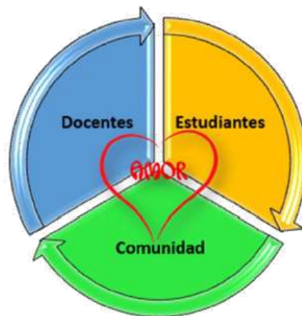
Gráfico 3. Proceso educativo desde el amor

Igualmente, la participación de la familia en la acción de la escuela eleva los estándares desde el proceso de enseñanza y aprendizaje más sensible y humano relacionado con lo social, en efecto, Peña (2018) manifiesta: “la familia es el espacio para beneficiar la convivencia y un clima socioafectivo favorable para el libre desarrollo integral de los estudiantes, quienes también son actores para la transformación que requiere la escuela y la comunidad”. (p. 214). En ese sentido, se muestra a continuación el gráfico 3.