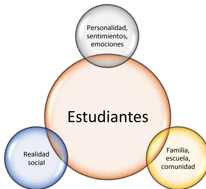
Gráfico 2. Estudiante como centro del enfoque holístico

estudiantes. En este sentido, el epicentro de la acción mediadora y holista del docente está vinculado a la práctica desde el amor, con un enfoque humanista, espiritual y mediador para seres humanos en donde se impulsa la formación de ciudadanos más responsables, solidarios, humanos y conscientes de su entorno para consolidar el desarrollo sustentable en valores y principios sociales, como se ilustra en el gráfico 2.